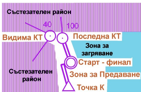
Технически данни за маршрутите – Щафети